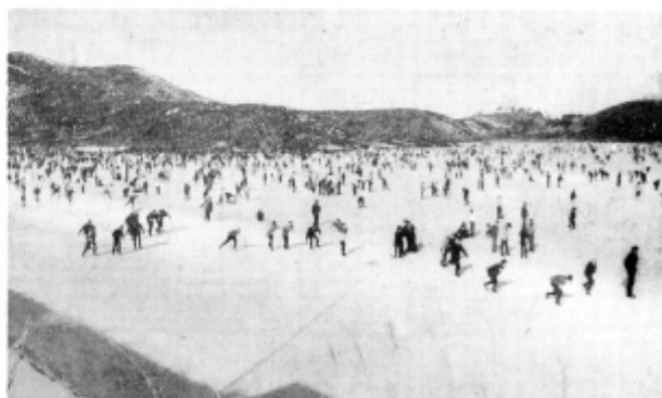
保古の湖スケート場