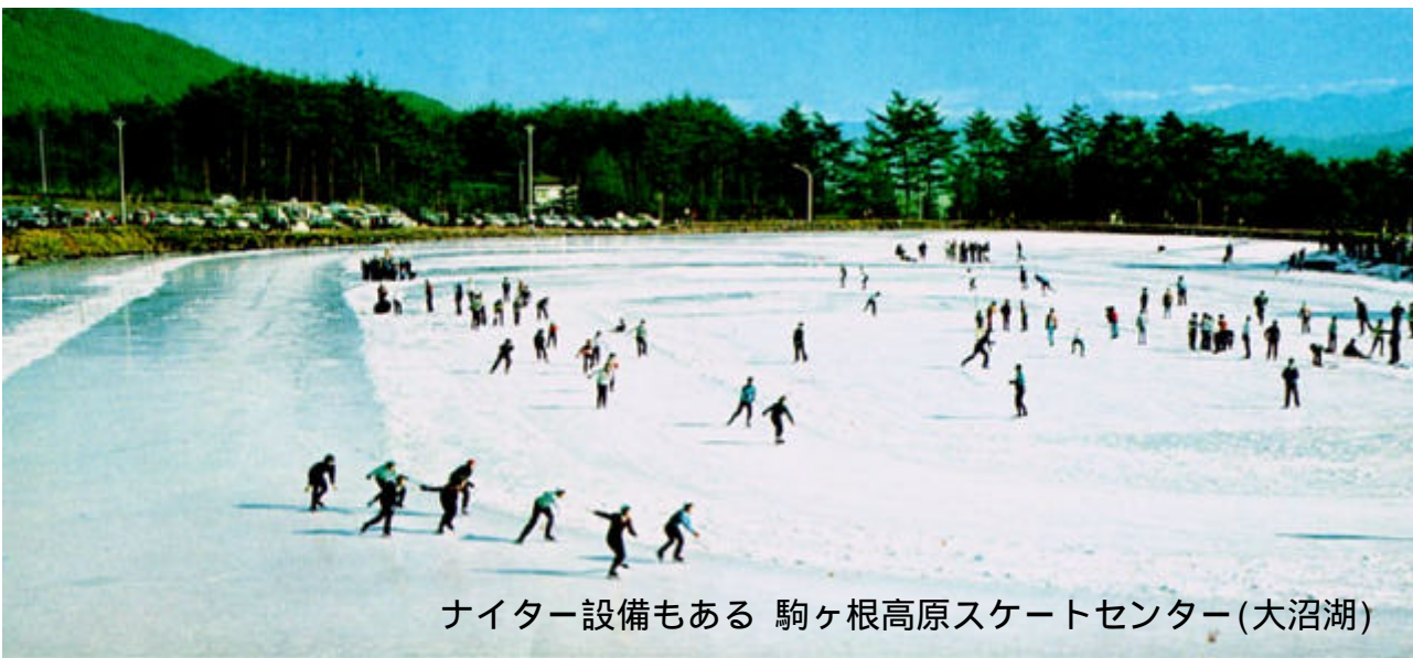
ナイター設備もある 駒ヶ根高原スケートセンター(大沼湖)