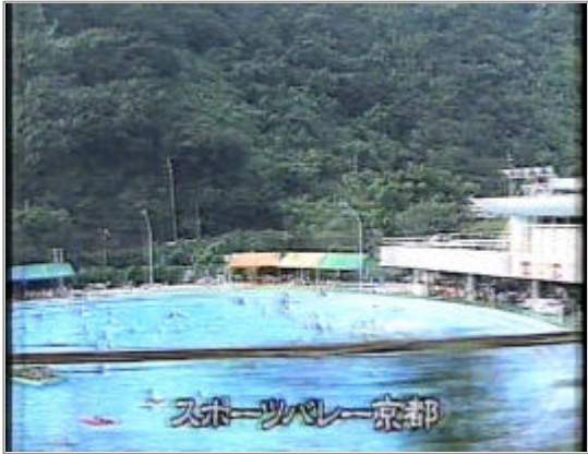
車窓から見た「スポーツバレー京都」のプール

最寄駅も“八瀬遊園駅” “八瀬遊園駅(スポーツバレー京都)” “八瀬比叡山口”と翻弄された