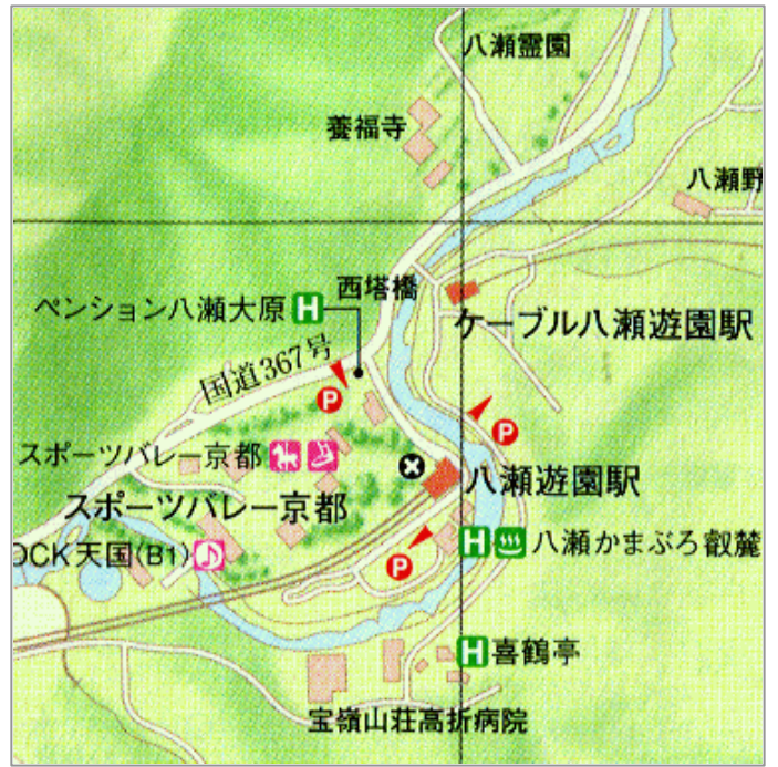
ピアマップ「大阪神戸京都」(H11)

八瀬遊園地 比叡山ケーブルの登り口、桜と赤松、高野川の瀬音の中に子供の遊び場や料理茶屋が散らばっている。花・壺・紅葉・菊によく、釣も楽しめる。 あし 京都バス八瀬下車、30分、40円、または出町柳から京福電車15分30円。 入園 遊園地無料。かまぶろヘルスセンター150円。